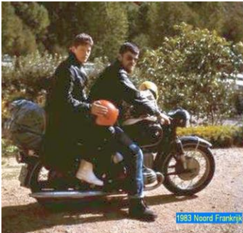
1983 Noord Frankrijk