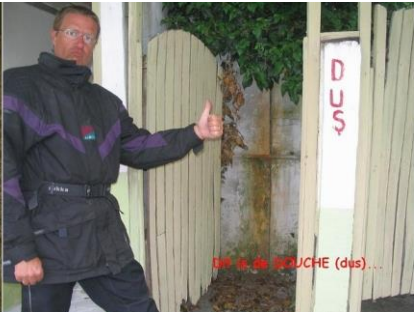
1994 de BUCHE (dus)...