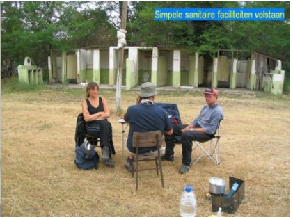
Simpele sanitaire faciliteiten volstaan