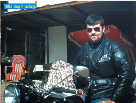
1983 Sep Frankrijk