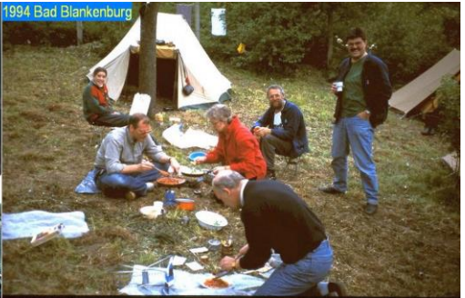
1994 Bad Blankenburg