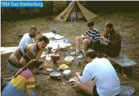
1994 Bad Blankenburg